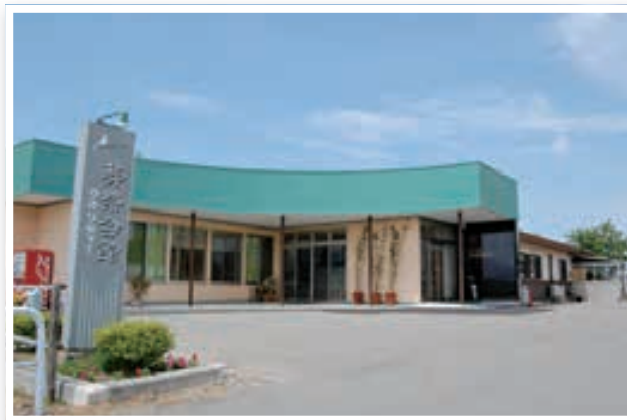
葬祭会館 クオリティー