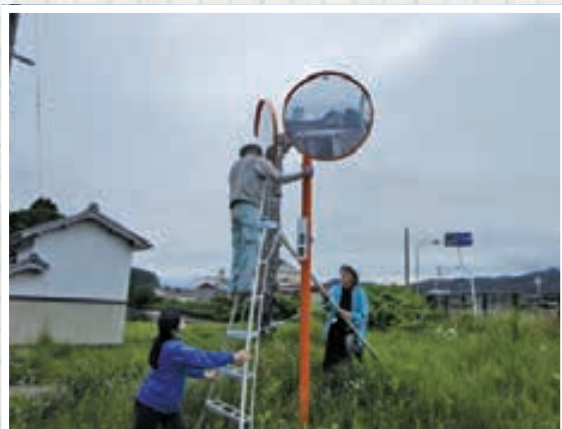
▲6/16 朝日地域カーブミラー清掃 29名参加