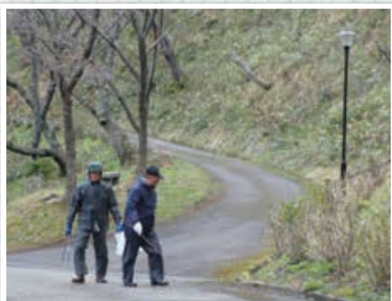
▲4/9 第6・7ブロック(大山公園) 14名参加