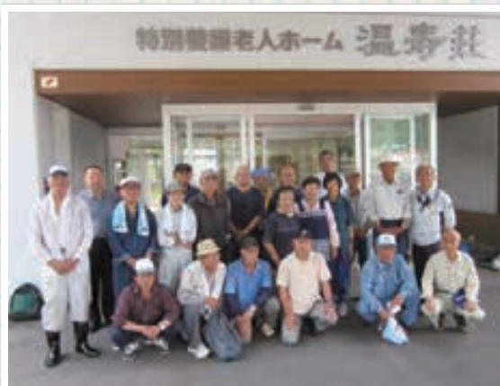
▲6/8 温海地域(温寿荘) 20名参加