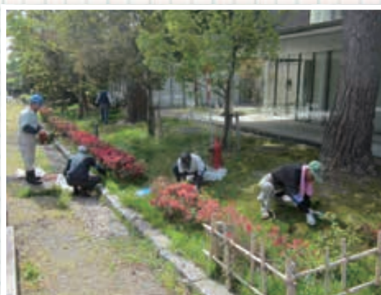
▲5/16 鶴岡公園 40名参加