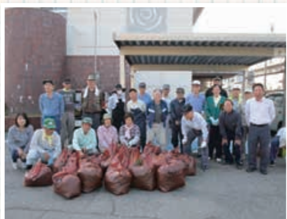
▲6/3 第4ブロック(第4コミセン) 26名参加