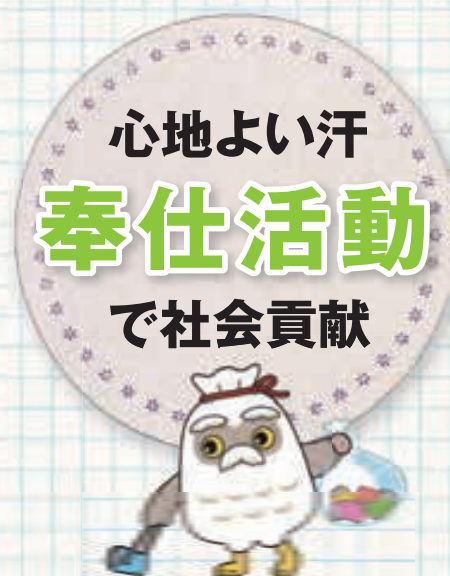
シルバー人材センターゆるキャラ 「チエブクロー」