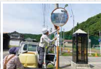
▲6/22 朝日地域 21名