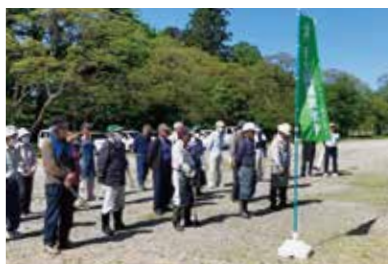
▲5/15 鶴岡公園 24名