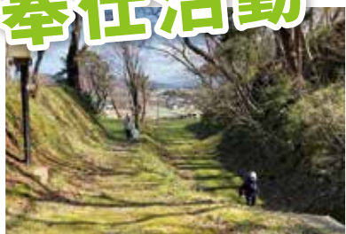
▲4/10 大山公園 13名