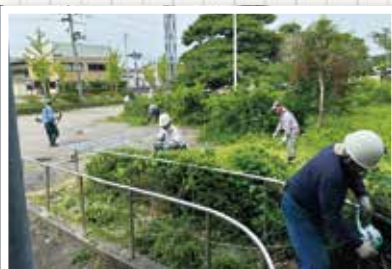
▲6/21 藤島地域 9名