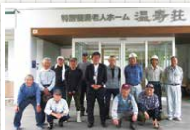
▲6/7 温海地域 12名