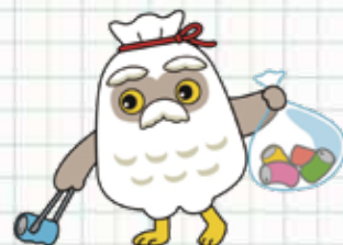
シルバー人材センター ゆるキャラ「チエブクロ」